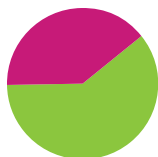
Gesamtlieferung Stadtwerke Landsberg KU (Unternehmensmix)